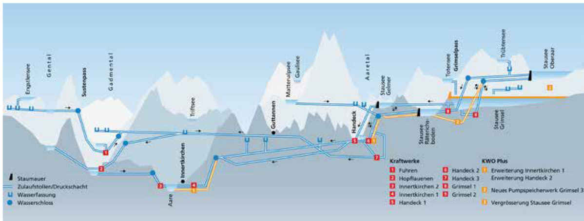
➤ Gráfico : Central hidroeléctrica Oberhasli AG

Las averías de alta impedancia se visualizan con el método SIM/MIM (Método del Impulso Secundario/Método de Impulso Múltiple). Para ello, el punto de la avería de alta impedancia es «cebado» con un impulso de alta tensión que lo convierte, momentáneamente, en un punto de avería de baja impedancia. De ese modo, se puede averiguar la distancia existente hasta el punto de la avería. El software del equipo –por ejemplo el del Syscompact 2000 o el Syscompact 3000– evalúa y visualiza esta distancia. El método SIM/MIM resulta especialmente ventajoso, ya que permite prelocalizar la avería hasta en el 98 % de los casos.