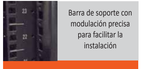
Barra de soporte con modulación precisa para facilitar la instalación