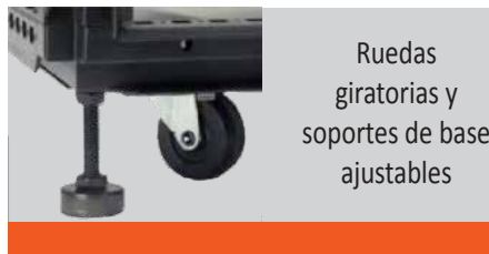
Ruedas giratorias y soportes de base ajustables