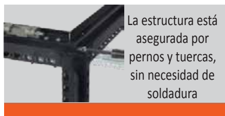
La estructura está asegurada por pernos y tuercas, sin necesidad de soldadura