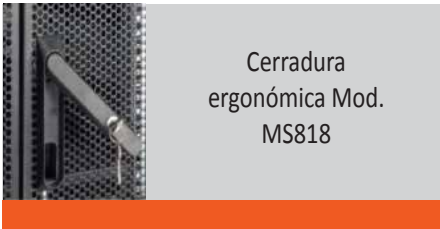
Cerradura ergonómica Mod. MS818