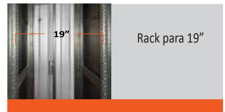
Rack para 19"